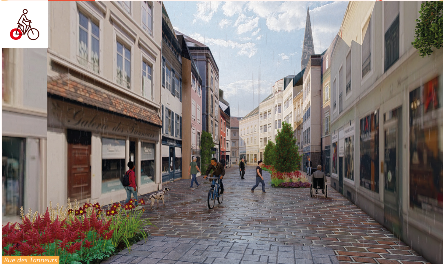
Rue des Tanneurs

L'accès aux commerces est maintenu et un jalonnement piéton particulier est mis en œuvre pour faciliter les circulations piétonnes pendant toute la durée des travaux.