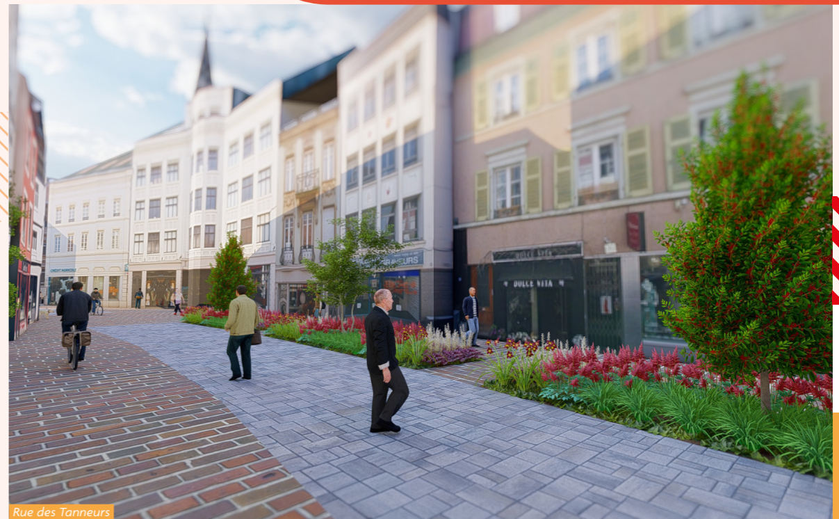
Rue des Tanneurs