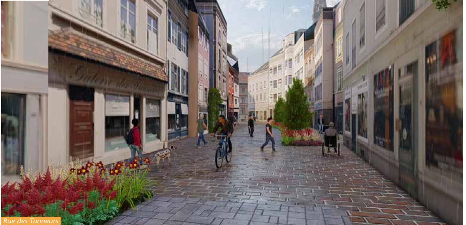
Rue des Tanneurs