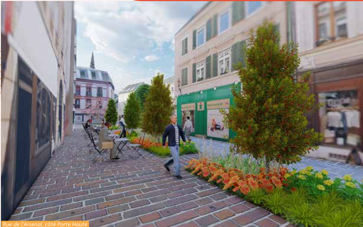
Rue de l'Arsenal, côté Porte Haute